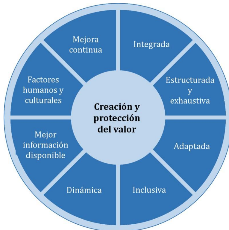
Figura 2 — Principios

Los principios descritos en la Figura 2 proporcionan orientación sobre las características de una gestión del riesgo eficaz y eficiente, comunicando su valor y explicando su intención y propósito. Los principios son el fundamento de la gestión del riesgo y se deberían considerar cuando se establece el marco de referencia y los procesos de la gestión del riesgo de la organización. Estos principios deberían habilitar a la organización para gestionar los efectos de la incertidumbre sobre sus objetivos.