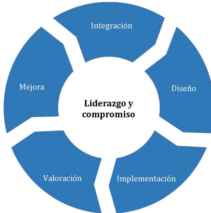
Figura 3 – Marco de referencia

La organización debería valorar sus prácticas y procesos existentes de la gestión del riesgo, valorar cualquier brecha y abordar estas brechas en el marco de referencia.