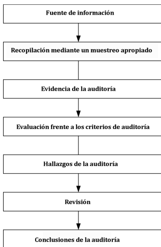
Figura 2 — Visión general de un proceso típico de recopilación y verificación de la información

La Figura 2 proporciona una visión general de un proceso típico, desde la recopilación de información hasta las conclusiones de la auditoría.