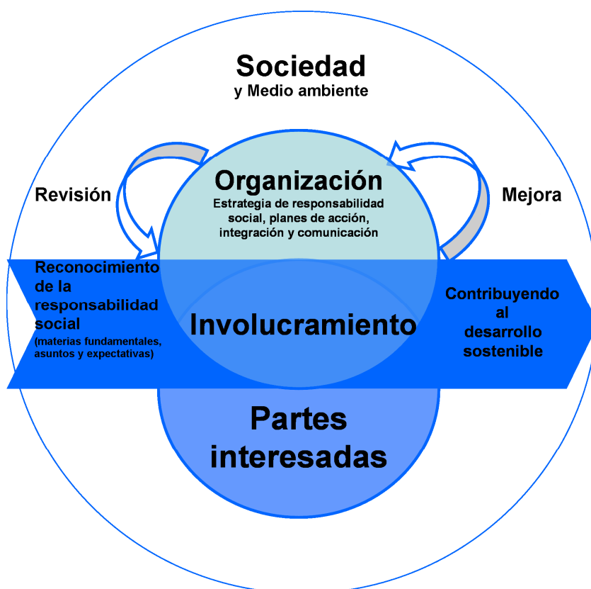
Figura 4 — Integración de la responsabilidad social en toda la organización

Puede que algunas organizaciones ya hayan establecido técnicas para introducir nuevos enfoques en su toma de decisiones y sus actividades, así como sistemas eficaces de comunicación y revisión interna. Otras puede que tengan sistemas menos desarrollados para la gobernanza de la organización u otros aspectos de la responsabilidad social. La siguiente orientación pretende ayudar a todas las organizaciones, cualquiera que sea su punto de inicio, a integrar la responsabilidad social dentro de su manera de operar (véase la Figura 4).