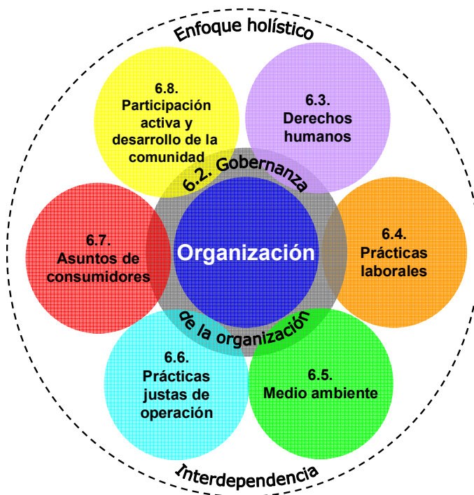
Figura 3 — Las siete materias fundamentales

El capítulo 7 ofrece mayor orientación acerca de la integración de la responsabilidad social.