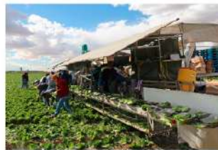
+ Equipo de cosecha