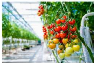
+ Agricultura interior