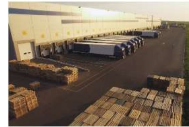
+ Almacenamiento y distribución